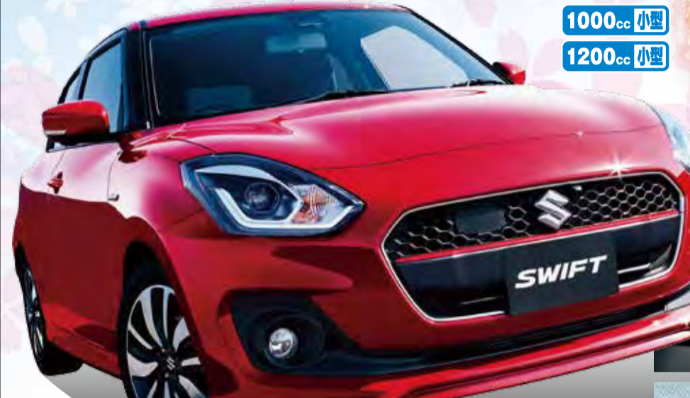
Photo:HYBRID RS レーダーブレーキサポート(前方・側方)全周モニター(パナソニック製)搭載車 車両本体価格の一例 HYBRID RS 1200cc 2WD CVT 169.128万円

JC08モード 燃料消費率(国土交通省審査値) 1.2Lデュアルジェットエンジン 27.4 Km/L 1.0Lブースタージェットエンジン(ターボ) 20.0 Km/L